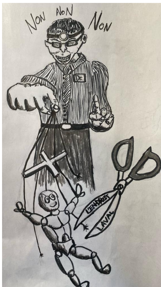
Dessin de Thomas Foulidis - membre

Bien qu'il ne s'agit ici que d'un bref survol théorique, l'application d'une telle conception demeure le vrai défi et c'est sur cela qu'on doit se concentrer. On doit s'indigner collectivement de l'état actuel des choses tout en revendiquant ensemble des changements structurels, et ce, dans l'espoir d'un avenir meilleur pour toutes et tous.